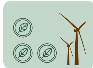
Figura 2. Descripción de la figura

Regla: solo 2-4 hallazgos principales. Por cada hallazgo escriba: Dato + unidad + comparación (T1 vs T0) + p-valor (si aplica). 1 frase: qué significa (interpretación). Literatura: máximo 1-2 citas para comparar. Extensión: 150-200 palabras. No hacer: resultados sin números; discusión tipo artículo.